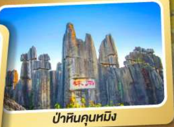
ป่าหินคุณหมิง