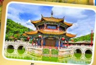
วัดหวนทอง