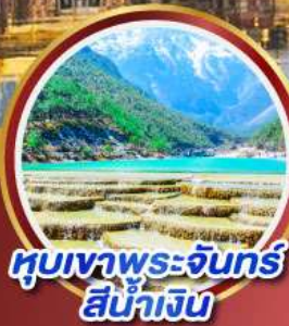
หุบเขาพระจันทร์ สีน้ำเงิน