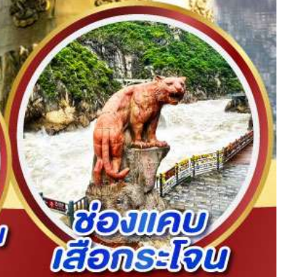
ช่องแคบ เสื่อกระโจน