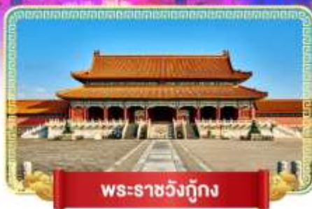
พระราชวังกู้กง