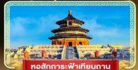
หอสังเกตการณ์เทียนถาน