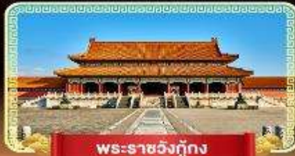
พระราชวังกู้กง