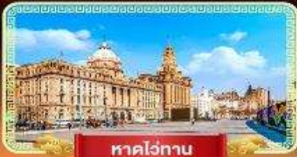
ทาดไว่ทาน