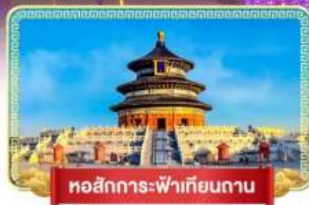
หอสังการะฟ้าเทียนถาน