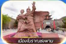
เมืองโบราณหลงพาน