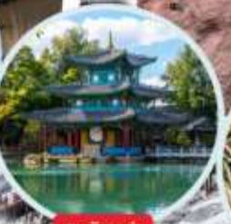
สระบัวกรต้า