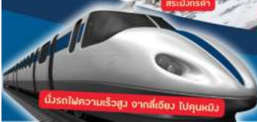
นั่งรถไฟความเร็วสูง จากลี่เจียง ไปคุนหมิง