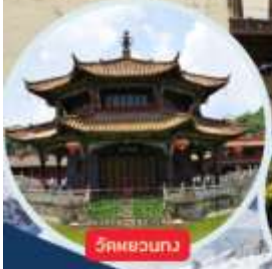
วัดผยวงกวง