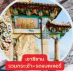
เขามีสาน สวนกระถิน้ำ+รถลขตเตอร์