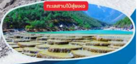
ทะเลสาบไป๋ส่วยเหอ