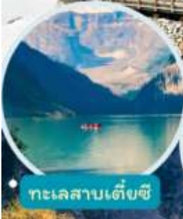
ทะเลสาบเต๋ยซี