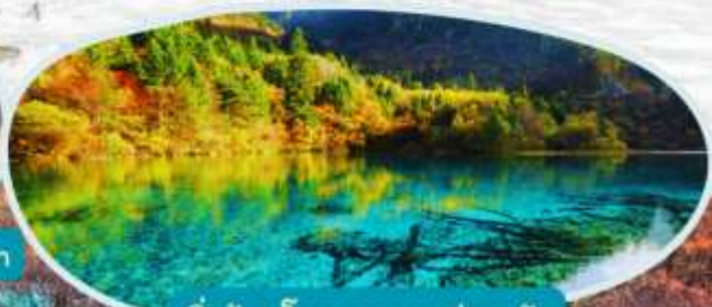
จิวจ้ายโกว รวมรถส่วนตัว