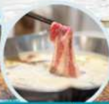
เมนูพิเศษ สุกี่หม่าล่า