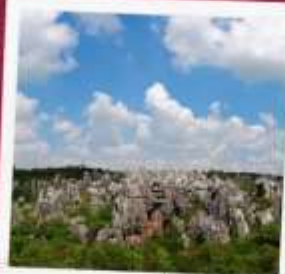
อุทยานป่าหิน