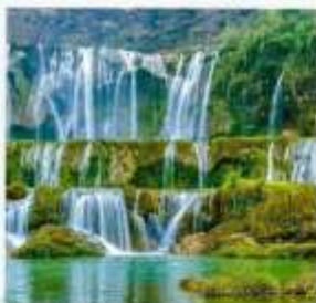
น้ำตกเก้ามังกร