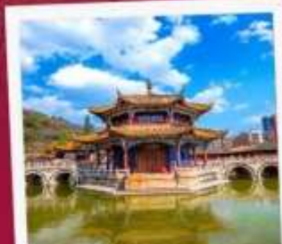
วัดหยวนทอง