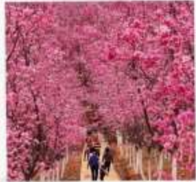
หุบเขาซากระหมื่นลี