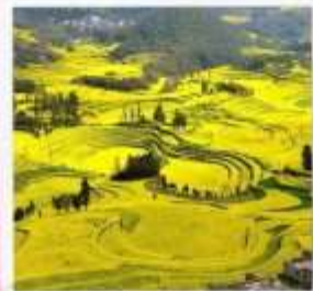
จุดชมวิวกุเขาไก่ทอง