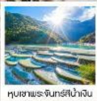
หุบเขาพระจันทร์สีน้ำเงิน