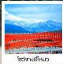
โจวจางอีไห่