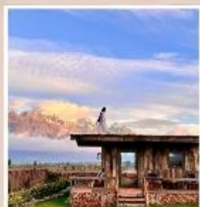
YUN DI AN CAFE