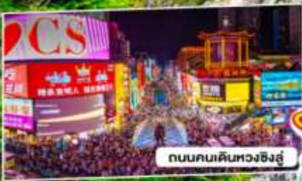
ถนนคนเดินหวงซิงอู่