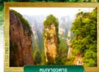
หินเงาอวดสาร