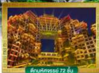
ตึกมหัศจรรย์ 72 ชั้น