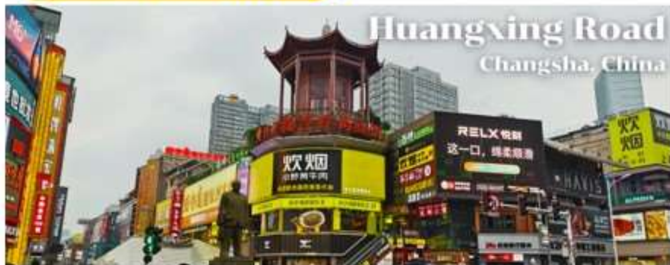
Huangxing Road Changsha, China

🕒 รับประทานอาหารเช้า นี้อที่ 13 # โรงแรม