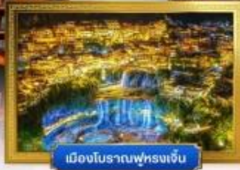
เมืองโบราณฟูหรงเจิน