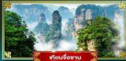
เทียนจ้อซาน