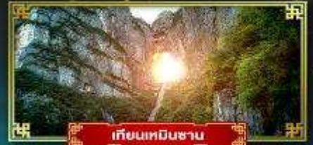
เทียนหมินซาน