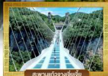
สะพานแก้วจางเจียเจีย