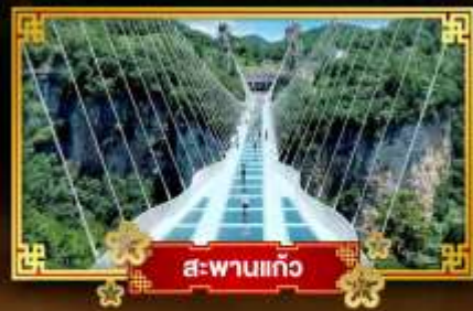
สะพานแก้ว