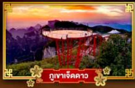
ภูเขาเจ็ดดาว

15,999.- ราคาเริ่มต้น 📅 เดินทาง : ม.ค. - เม.ย 68