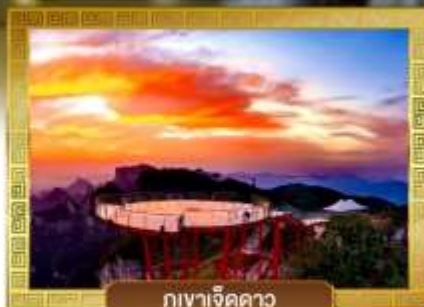
กุเวาเจ็ดดาว