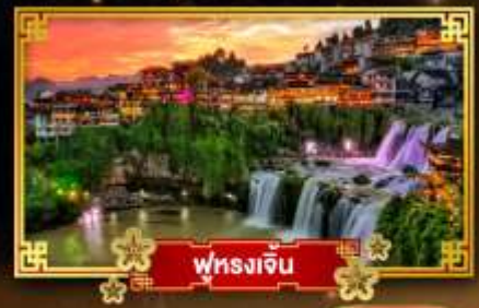
ฟุรงเจิน