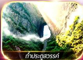
ท่าประตูลั่วฉวร์