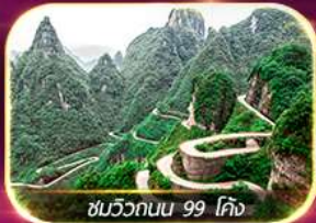
ชมวิวกบนน 99 โค้ง