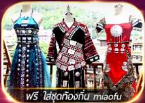
ฟรี ใส่ชุดท้องถิ่น miaofu

นั่งรถไฟความเร็วสูง 1 ขา พักในเมืองโบราณเฟิงหวง