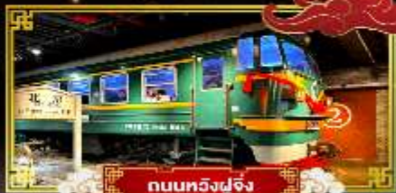
ถนนทวิงฟูจิ่ง