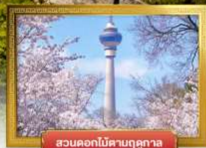
สวนดอกไม้ตามฤดูกาล