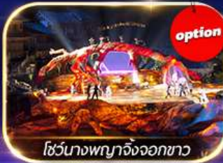
โชว์นางพญาจิ้งจอกขาว