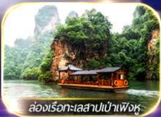
ล่องเรือทะเลสาบเป่าเฟิงหู