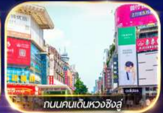
ถนนคนเดินหวงซิงสู๋

ล่องเรือชมเมืองโบราณ ฟุรงเจิน + ทะเลสาบเป่าเฟิงหู