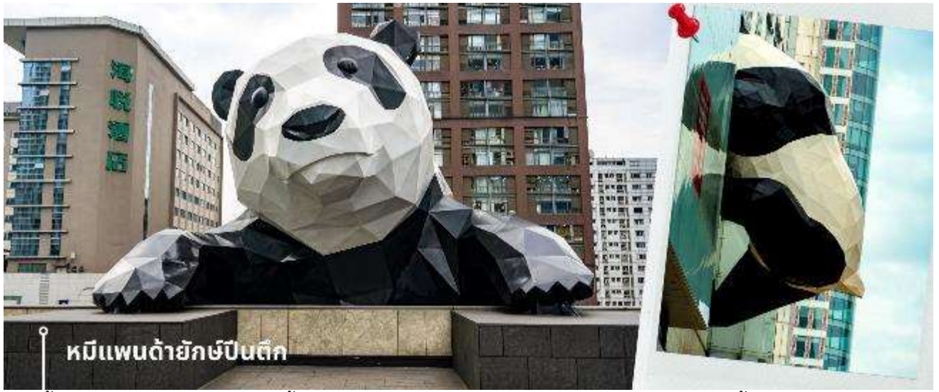
หมีแพนด้ายักษ์ปักกิ่ง

จากนั้นให้ท่านให้อิสระกับการเลือกซื้อสินค้าของฝากที่ ถนนไท่กุ่หลี่ และ ถนนชุนซีลู่ ในย่านนี้เป็นถนนโบราณ ในอดีตเคยโรงงานผลิตผ้าไหมใหญ่ที่สุดในจีน ปัจจุบันได้เปลี่ยนเป็นถนนช้อปปิ้งแหล่งสวรรค์ของนักท่องเที่ยว เป็นถนนคนเดิน มีห้างสรรพสินค้าชื่อดัง มีร้านค้ามากกว่า 700 ร้านค้าที่เต็มไปด้วยสินค้าต่าง ๆ ทั้งร้านค้าแฟชั่น ร้านอาหารและโรงแรมนานาชาติมากมายซึ่งเป็นที่ยอดนิยมที่มีการเชื่อมต่อทางวัฒนธรรมท้องถิ่นที่เป็นแหล่งช้อปปิ้งและเป็นแหล่งร้านอาหารที่อร่อยต่าง ๆ มากมาย ซึ่งเป็นสถานที่เที่ยวของเฉิงตูที่ทำให้เพลิดเพลินกับสินค้าแบรนด์เนมและแบรนด์จีน เพื่อให้นักท่องเที่ยวได้เลือกซื้อตามอิสระ แะร้าน POP MART