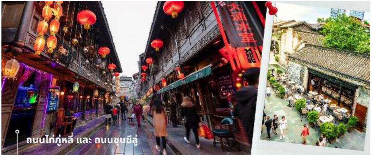
ถนนไท่กุ่หลี่ และ ถนนชุนซีลู่

จากนั้นให้ท่านให้อิสระกับการเลือกซื้อสินค้าของฝากที่ ถนนไท่กุ่หลี่ และ ถนนชุนซีลู่ ในย่านนี้เป็นถนนโบราณ ในอดีตเคยโรงงานผลิตผ้าไหมใหญ่ที่สุดในจีน ปัจจุบันได้เปลี่ยนเป็นถนนช้อปปิ้งแหล่งสวรรค์ของนักท่องเที่ยว เป็นถนนคนเดิน มีห้างสรรพสินค้าชื่อดัง มีร้านค้ามากกว่า 700 ร้านค้าที่เต็มไปด้วยสินค้าต่าง ๆ ทั้งร้านค้าแฟชั่น ร้านอาหารและโรงแรมนานาชาติมากมายซึ่งเป็นที่ยอดนิยมที่มีการเชื่อมต่อทางวัฒนธรรมท้องถิ่นที่เป็นแหล่งช้อปปิ้งและเป็นแหล่งร้านอาหารที่อร่อยต่าง ๆ มากมาย ซึ่งเป็นสถานที่เที่ยวของเฉิงตูที่ทำให้เพลิดเพลินกับสินค้าแบรนด์เนมและแบรนด์จีน เพื่อให้นักท่องเที่ยวได้เลือกซื้อตามอิสระ แะร้าน POP MART