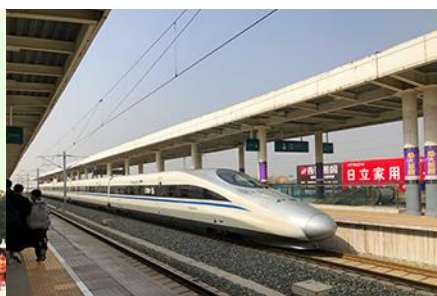
นิ่รถไฟความเร็วสูง