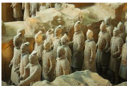
สุสานกองทัพทหารม้าฉินซี

พักที่ XINYUAN HOTEL 4* หรือ โรงแรมในระดับเดียวกัน เมืองหัวซาน