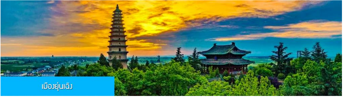
เมืองยฺว่เฉิง