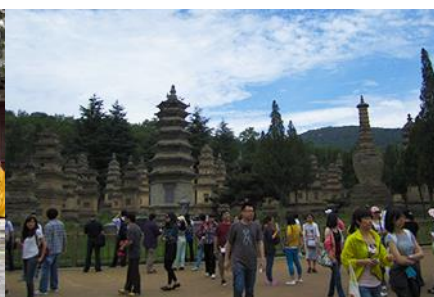
ป่าเจดีย์