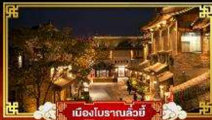
เมืองโบราณลวี้