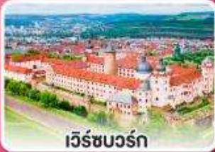
เวิร์ชบวร์ค