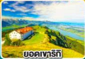
ยอดเขารัทท์