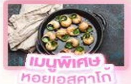
เมนูพิเศษ หอยออสตาโก้

เยอรมัน เนเธอร์แลนด์ เบลเยียม ฝรั่งเศส Keukenhof