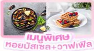
เมนูพิเศษ หอยมัสเซล+วาฟเฟิล