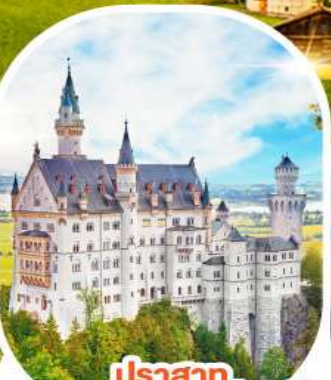
ปราสาท นอยชวานชไตน์