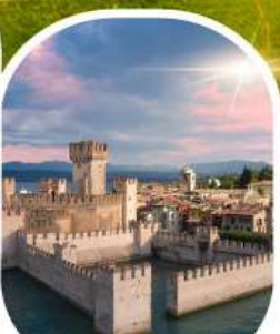
ซีร์มิโอเน