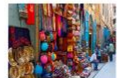
ตลาดขานเอลคาลลี

20.50 น. ออกเดินทางสู่อิสตันบูล เที่ยวบิน TK695