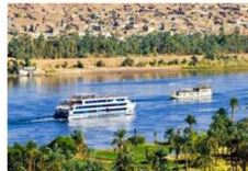
พักผ่อนตามอัธยาศัย บนเรือสำราญ

** พักที่ JAZ Crown Jewel Nile Cruise 4* หรือเทียบเท่า **