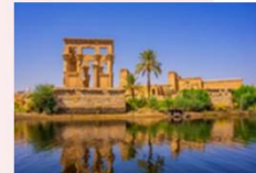
วิหารฟิเล

16.25 น. ออกเดินทางสู่กรุงโคโร สายการบิน Egypt Airlines เที่ยวบิน MS295