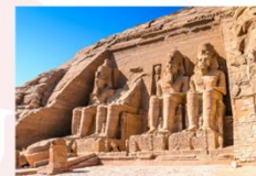
มหาวิหารอาบูซิมเบล

** พักที่ JAZ Crown Jewel Nile Cruise 4* หรือเทียบเท่า **