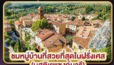
ชมหมู่บ้านที่สวยงามที่สุดในฝรั่งเศส (มูสติเยแซงท์มาร์)