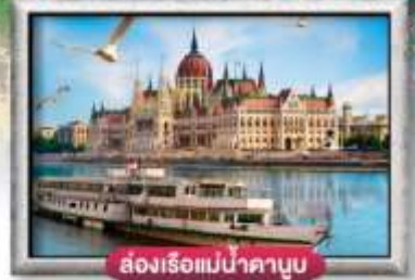
ส่องเรือแม่น้ำดานูบ

พิเศษ!! ลิ้มลองเมนูประจำชาติ ทั้ง 5 ประเทศ!!!