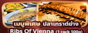
เมนูพิเศษ ปลาเทราต์ย่าง Ribs Of Vienna (1 rack 500g)

กาสิโน 15 ท่านออกเดินทาง พร้อมหัวหน้าทัวร์คนไทย