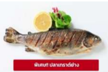
พิเศษ! ปลาเทราต์ย่าง

นำท่านเดินทางสู่ เมืองลินซ์ (Linz) (ระยะทาง 125 กม./ 2 ชม.) เป็นเมืองที่มีการผลิตเหล็ก เครื่องจักร อุปกรณ์ไฟฟ้า อดีตเป็นศูนย์กลางการค้าที่สำคัญ ให้ท่านถ่ายรูปบริเวณด้านนอก พิพิธภัณฑ์แห่งโลกอนาคต (Ars Electronica Center) ตั้งอยู่ริมแม่น้ำดานูบ เป็นที่จัดแสดงวิทยาการต่างๆ ที่ส่งผลต่อมวล มนุษย์ปัจจุบัน ไม่ว่าจะเป็นอวกาศ หุ่นยนต์และเอไอ ยารักษาโรค เป็นต้น