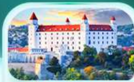
ปราสาทบราติสลาวา

เที่ยวชมเมืองอัลสตัดท์ หมู่บ้านริบทะเลสาบสวยที่สุดในโลก พระราชวังเซินบรุนน์ เมืองลินซ์ จิตรกรรมฝาผนังยักษ์ สัมผัสเมืองมรดกโลก เซสท์ ครุมลอฟ เยี่ยมชมปราสาทปราก ถนนทองคำ เช็กอินสถานที่ชื่อดัง! ปราสาทบราติสลาวา ส่องเรือชมความงามแม่น้ำดานูบ แม่น้ำที่ยาวที่สุดในยุโรป ชมความน่าหลงใหลของ ปราสาทบูคาเปสต์ สะพานชาร์ลส์