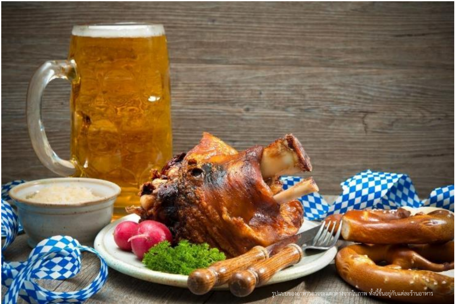
รูปแบบของอาหารอาจจะแตกต่างจากในภาพ ทั้งนี้ขึ้นอยู่กับแต่ละร้านอาหาร

จากนั้นนำท่านเข้าสู่ที่พัก 🏠 Mercure Hotel Muenchen Sued Messe หรือเทียบเท่า