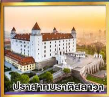
ปราสาทบราติสลาวา