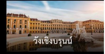
วังเซิงบรุนน์