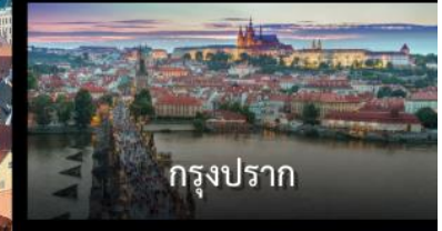
กรุงปราก