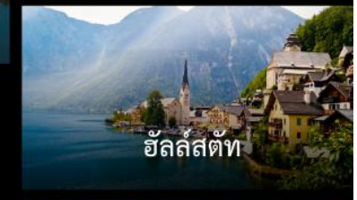
ฮัลล์สตัดท์