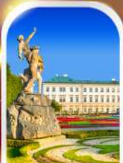
MIRABELL PALACE AUSTRIA