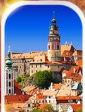
CESKY KRUMLOV CZECH