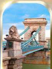
CHAIN BRIDGE BUDAPEST