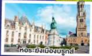
ทอร์ซิงเมืองบรูจส์