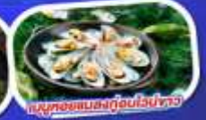
เมนูทอยแอมलगู๋อบไวน์ขาว