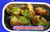
เมนูทอยแอมलगู๋อบไวน์ขาว

ทานอาหาร ณภัตตาคารบนหอไอเฟล พร้อมชมวิวแสนโรแมนติก เมนูทอยแอมलगู๋อบไวน์ขาว