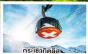
กระเช้าทิดลิส

ฝรั่งเศส เบลเยียม เนเธอร์แลนด์ 10วัน ลักเซมเบิร์ก สวิตเซอร์แลนด์ 7คืน