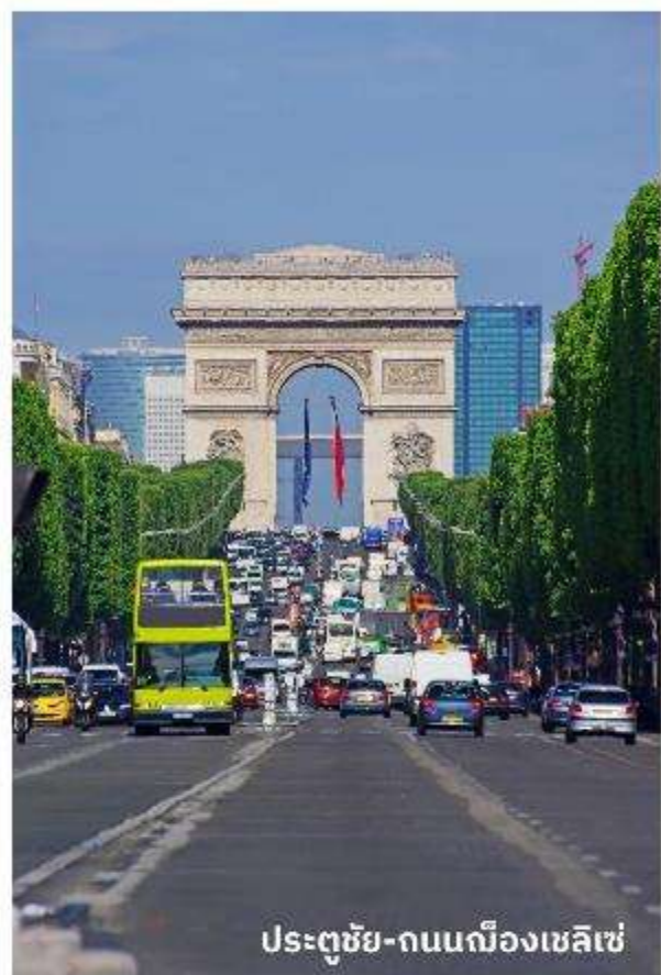
ประตูดัชชี่-ถนนฌ็องเซลิเซ่

บริการอาหารกลางวัน ณ ภัตตาคาร จากนั้นนำท่านเดินทางท่องเที่ยวตามสถานที่ ที่มีชื่อเสียงของกรุงปารีส