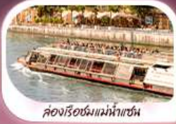
คองเรือชมแม่น้ำแซน