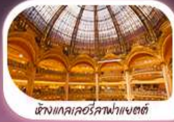
ห้างแลคซอร์คอฟ้าแซตต์