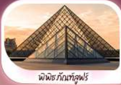
พิพิธภัณฑ์ลูฟร์