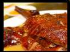
ห่านย่าง