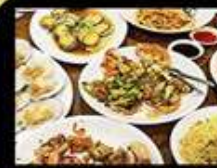
LEI YUE MUN