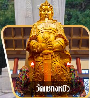
วัดเขangkงหิว