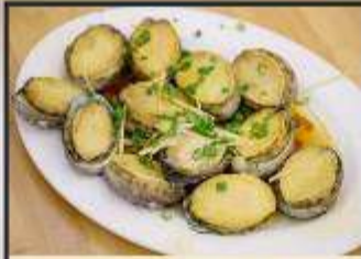
เป่าอ้อสดหนึ่ง