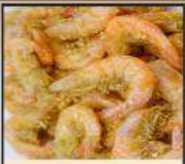
กุ้งทอดกระเทียม