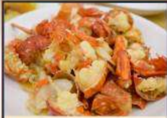
กุ้งมังกรอบซีส