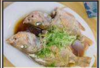
ปลาหนึ่งซีอิ้ว