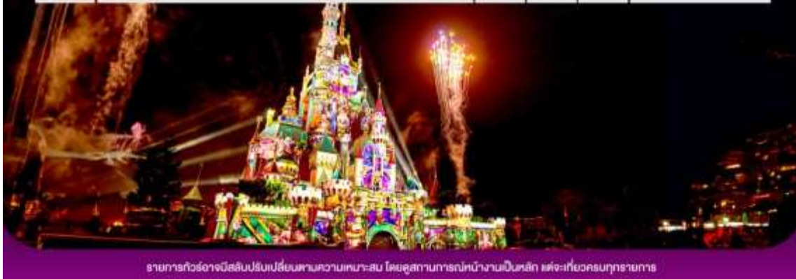
รายการทัวร์อาจมีปรับเปลี่ยนตามความเหมาะสม โดยดูสถานการณ์นำงานเป็นหลัก แต่จะเกี่ยวข้องทุกรายการ