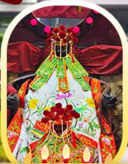
เจ้าแม่กวนอิมฮ่องฮำ