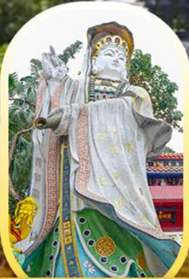
วัดเจ้าแม่กวนอิมรี พลัสเบย์