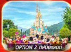
OPTION 2 ดิสนีย์แลนด์

เต็มอิ่ม ทั้งไหว้พระ-ขอพร การเงิน การงานความรักและซ่อมปัง