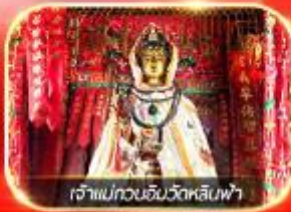
เจ้าแม่กวนอิมวัดหลินฟ้า