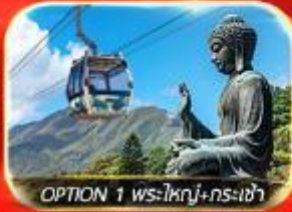
OPTION 1 พระใหญ่+กรงเจ้า