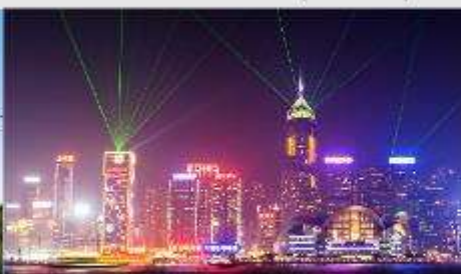
Symphony of Lights