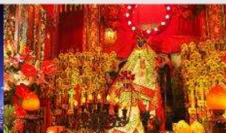
วัดเจ้าแม่กวนอิมของซ่า

*ทางบริษัทฯ ขอสงวนสิทธิ์ในการสลับโปรแกรมทัวร์ตามความเหมาะสมขึ้นอยู่กับสถานการณ์ปัจจุบัน โดยคำนึงถึงผลประโยชน์ของลูกค้าเป็นสำคัญ