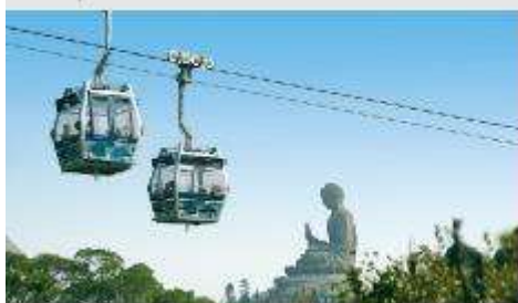
กระเช้าองปิง