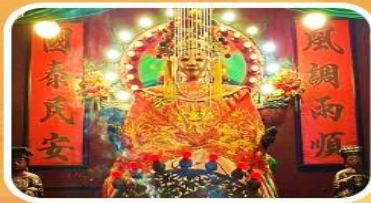
วัดเจ้าแม่กวนอิมเทียนหัว