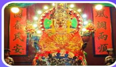
วัดเจ้าแม่กวนอิมเทียนหัว