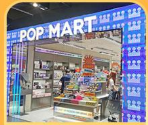
ช้อปปิ้ง POP MART