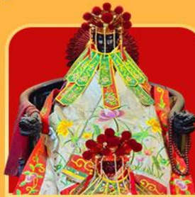
เจ้าแม่กวนอิมสองอำเภอ