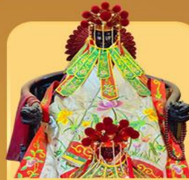
เจ้าแม่กวนอิมสองขำ