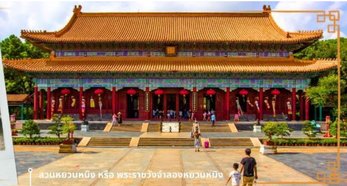
สวนหยวนหมิง หรือ พระราชวังจำลองหยวนหมิง